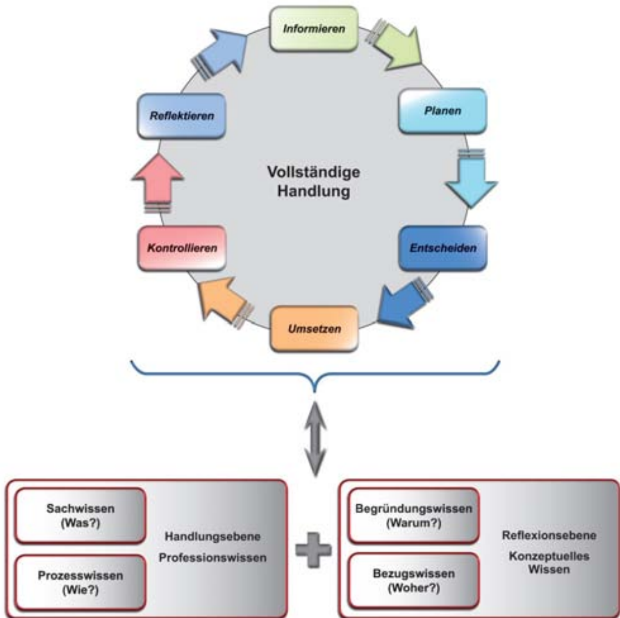
Abb. 4: Korrespondenz zwischen Wissenskategorien und dem Modell der vollständigen Handlung

In der Handreichung zu diesem Kerncurriculum wird der Zusammenhang zwischen den fachlichen Kompetenzbereichen aus dem Modell der vollständigen Handlung, den Wissenskategorien und Inhalten hergestellt sowie durch Lehr-Lern-Arrangements verdeutlicht.