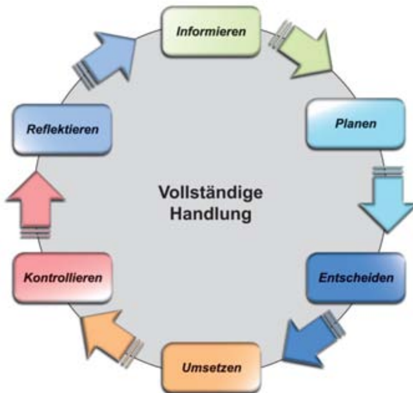
Abb. 2: Modell der „Vollständigen Handlung“

Der berufsbezogene Unterricht wird nach dem Modell der „vollständigen Handlung“ gestaltet: